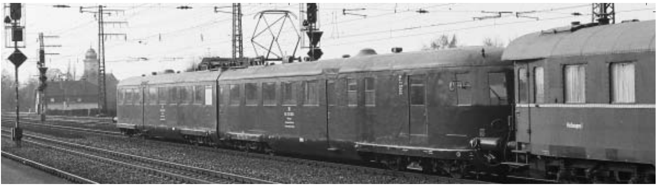
Der ET 31 im Bahnhof Pasing: Zum Zeitpunkt der Aufnahme im März 1969 dürfte es der letzte ET 31 der DB gewesen sein.