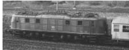
Oben: E 118 010-8 mit Bn-Wagen zwischen Bw und Bahnhof Pasing.