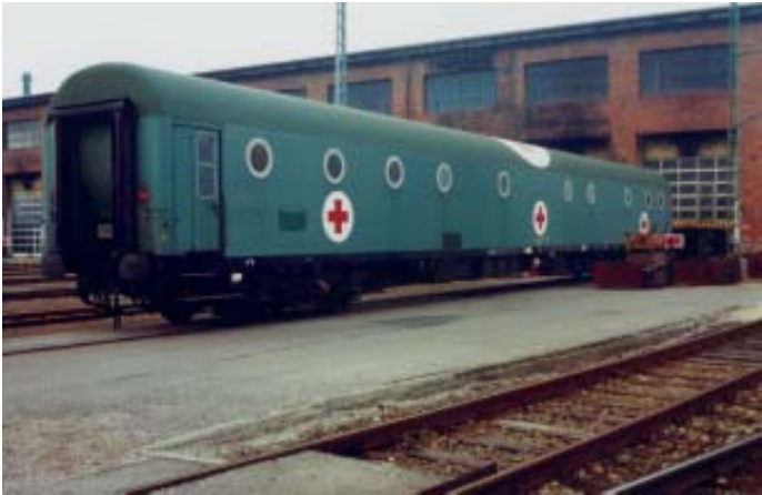
Auch dieser im September 1994 aufgenommene Lazarett-Wagen war Gast in der Reisezugwagen-Werkstatt.