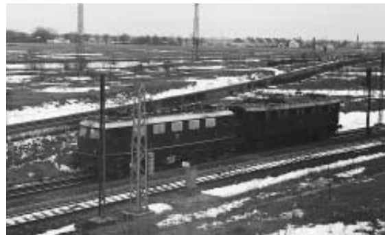
Die E 75 und E 40 am Westkreuz vor dem Einfahrsignal Pasing. Die „freie Fläche“ im Hintergrund existiert nicht mehr.