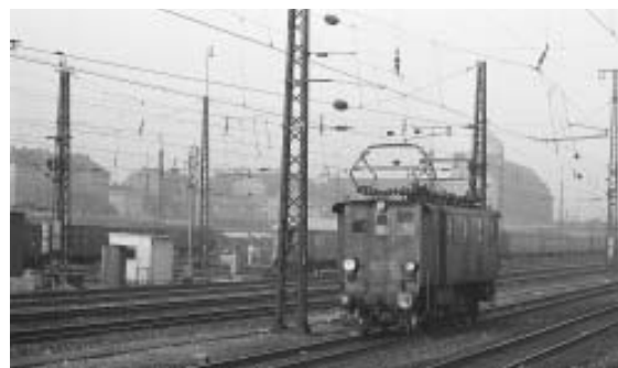
E 132 012-6 in Höhe des ehemaligen Haltepunktes „Hauptwerkstätte“ im September 1969.