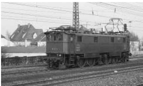
E 166 007-6 im Bahnhof Pasing im März 1969.