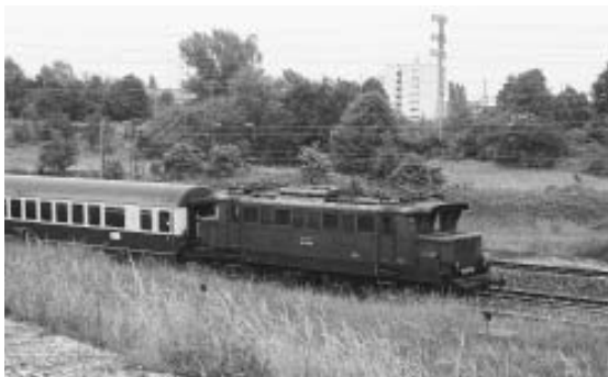
Die E 144 150-0 im Werk Pasing.